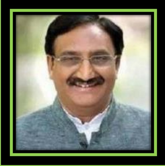
श्री रमेश पोखरियाल निशंक

(माननीय केंद्रीय मानव संसादन विकास मंत्री)